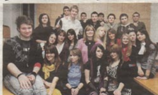
Pred učenicima 3. a razreda opsežne su pripreme za Svjetsko prvenstvo

Oni su izradili multimedijalne postere o Hrvatskoj, postavili ih na internetsku stranicu wikispaces te se virtualno povezali sa školama iz SAD-a, Velike Britanije, Australije, Por-