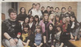
Pred učenicima 3.a razreda opsežne su pripreme za Svjetsko prvenstvo

Oduševljeni smo uspjehom projekta 'Greetings from the world'. Glavni je cilj da s ostalim školama razmjenjuje-mo razglednice svojih zemalja, kakve se ne mogu pronaći ni u jednom turističkom vodi-